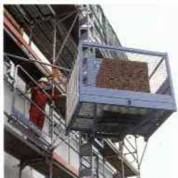
Зубчато-реечные подъемники со стальной мантой