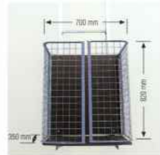
Универсальная платформа с откидными боковыми ограждениями – транспортное устройство для любых грузов.