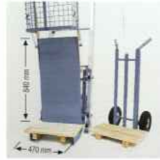
Для кровельщиков разработаны специальная платформа для подачи черепицы с шарнирно закрепленной решеткой и тележка.