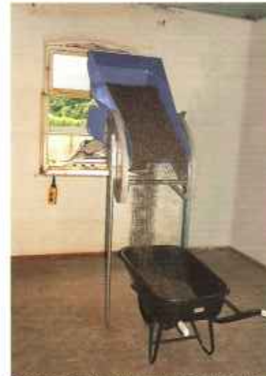
Опрокидывающийся скит в стандартной тележке разгружается автоматически благодаря опрокидывающему приспособлению, которое можно также с успехом использовать внутри здания. В комплект поставки входит регулируемая подпорка.

Подъемник GEDA-LIFT универсален при проведении как внутренних и наружных ремонтно-отделочных работ, так и работ на плоских крышах. Используя наш подъемник GEDA-LIFT , Вы сможете сэкономить время и деньги уже на следующем подряде.