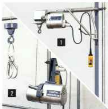
Канатные подъемники: 1 с консольной поворотной стрелой, 2 с креплением на лесах