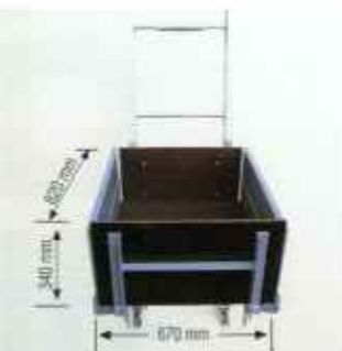
Трансформируемая платформа с откидными боковыми стенками. (Наклонность платформы можно регулировать).