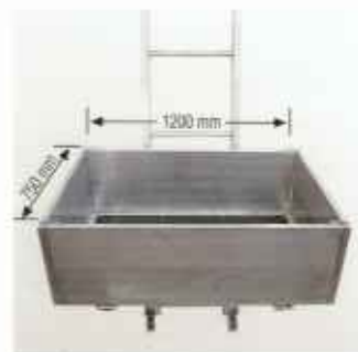
Большая трансформируемая платформа с тремя откидными боковыми стенками для транспортировки громоздких грузов (Наклонность платформы можно регулировать).