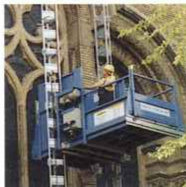
Транспортные платформы – Грузопассажирские подъемники