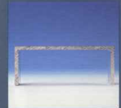
Лестничная секция для номинальной нагрузки в 150 кг

GEDA-LIFT „Standard” GEDA-LIFT „Comfort” GEDA-FIXLIFT