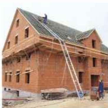
Наклонные подъемники со сталепроводящим тросом