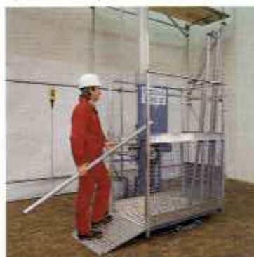
Зубчато-реечные подъемники с алюминиевой мантой.