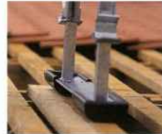
Благодаря наличию регулируемой опоры укладку черепицы можно производить и под лестницей.

Подъемник GEDA-LIFT тысячекратно себя зарекомендовал и одинаково популярен среди кровельщиков и рабочих общестроительных специальностей как оптимальное грузоподъемное устройство для любых применений. Помимо односкоростной модели особой популярностью у кровельщиков пользуется двухскоростная модель GEDA-FIXLIFT которая обеспечивает более высокую скорость подъема