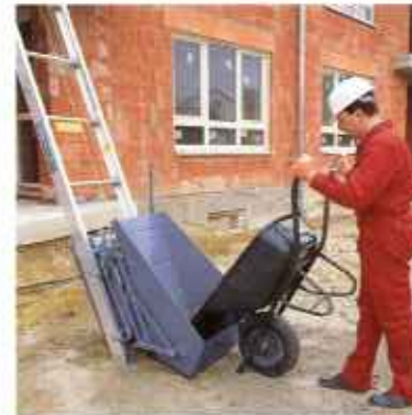
Удобная и практичная конструкция помогает просто и легко загружать и разгружать скит.

Подъемник GEDA-LIFT универсален при проведении как внутренних и наружных ремонтно-отделочных работ, так и работ на плоских крышах. Используя наш подъемник GEDA-LIFT , Вы сможете сэкономить время и деньги уже на следующем подряде.