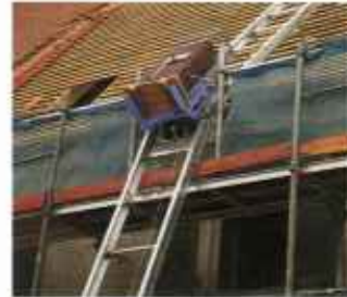
Угловая секция лестницы регулируется, обеспечивая установку подъемника при любом уклоне ската крыши.