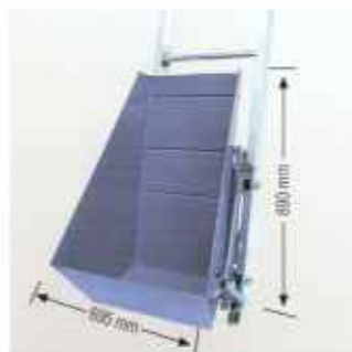
Опрокидывающийся скит для любых сыпучих материалов.