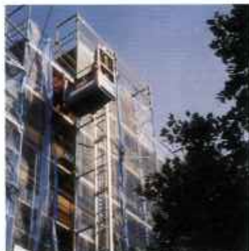
Наклонные и вертикальные зубчато-реечные подъемники