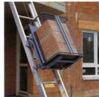
Универсальная платформа упрощает транспортировку жерлечей и блоков.