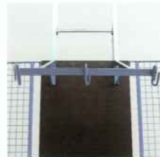
Подвеска для ведер (крепится к универсальной платформе) исключает пролив жидких материалов при подъеме по угловой секции лестницы!