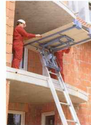
При использовании опрокидывающейся тележки с платформой для панелей легко выгружаются плиты даже больших размеров.

GEDA-LIFT „Standard” GEDA-LIFT „Comfort” GEDA-FIXLIFT