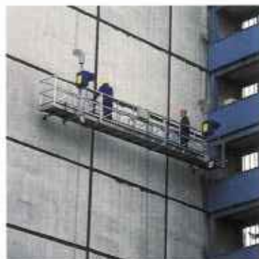
Подвесные рабочие платформы (люльки)