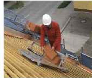
Удобная работа на крыше обеспечивается применением перемещающей по обрешетке подставки для черепицы.