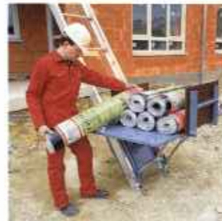
Тромозкие грузы легко поднимаются на трансформируемой платформе с откидными боковыми ограждающими стенками.