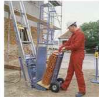
Быструю загрузку платформы для черепицы гарантирует использование тележки и двух поддонов