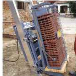
Безопасность подъема груза обеспечивается решеткой, которая опускается вниз и запирается в транспортном положении.