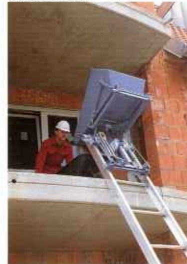
Скит может опрокидываться с поворотом на угол до 130° с помощью опрокидывающейся тележки (это особенно удобно когда подъемник установлен под углом, близким к 90° и в тесных условиях строительной площадки).