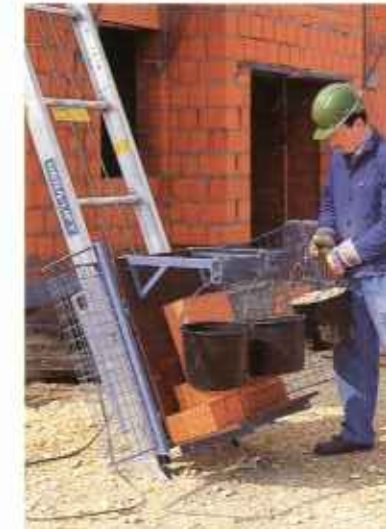
Характер подъемника позволяет транспортировку различных строительных материалов на универсальной платформе (на фото – с помощью подвески для ведер).