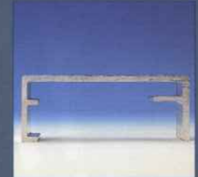
Усиленная лестничная секция для номинальной нагрузки в 200 кг