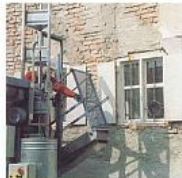
A szerelvények (udvarszervek) a felvonó és a szállítókosár közötti szigetelés miatt.