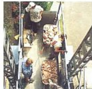
A felvonó csak helyet nyújt a terjedelmes és nehéz anyagoknak. „E” szállítókosár, mérete 1,45 x 3,0 m.