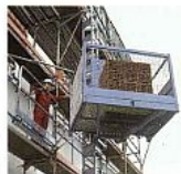
Független felvonók szőlő ostrompályával