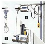
Kézi felvonók ■ Csúszó felvonók ■ Állványozási felvonók