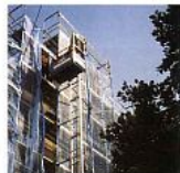
Ferdesípcsős felvonók és függőleges felvonók