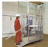
Független felvonók alumínium csúszópályával