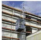
Személy- és teher szállító felvonók