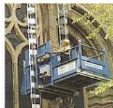
Személy- és teher szállító felvonók