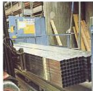
Hozzájárul a terjedelmes anyagok problémáinak elkerüléséhez. 17 szállítókosár, mérete 1,85 x 4,35 m.