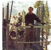
A szigetelés elleni védelemként a be- és kilépési helyeken a szigetelési emelési biztonság érdekében a szállítókosárban 1 db szigetelési matracot kell elhelyezni a szállítókosár szélénél.