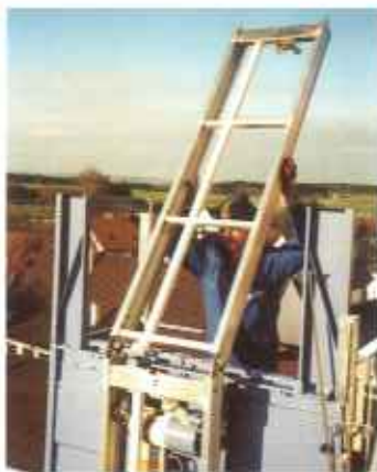
Durch ein patentiertes Verbindungs- system ist ein leichtes Auf- setzen und Demontieren möglich.