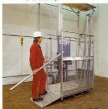
Zahnstangenaufzüge mit Aluminiummast