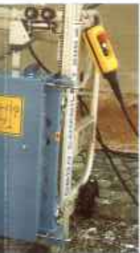
Grundeinheit – pas- recht- und Schrägein- aus: