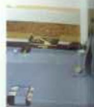
Das Schleppkabel in den Kabelkanal