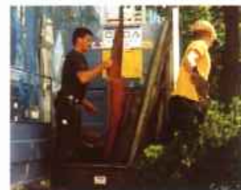
Bequemes Be- und Entladen von Gütern durch Öffnen der gesamten Frontseite.