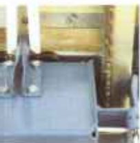
abel wird automatisch nal eingeführt.