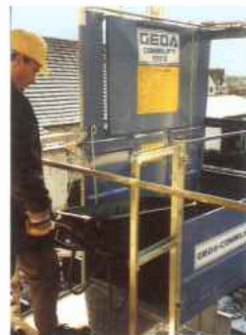
Gesicherter Übergang durch Klappe mit Scherengeländer.