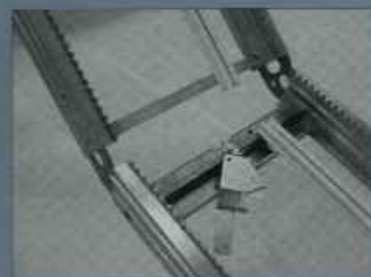
Leiterprofil 200 bzw. 250 kg Nutzlast