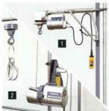
Seilaufzüge: ■ Schwenkarmzüge ■ Gerüstaufzüge