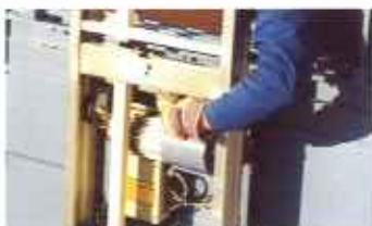
Die Verbindung der Leiterteile erfolgt über einen integrierten Schnellverschluß, der gleichzeitig als Überfahrerschutz und Endschal- teranfahrblech dient.