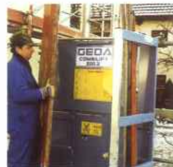
Lastbühne mit Halter für Gerüst- rohre.