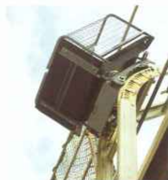
Das Knickstück (20°) kann mit Knickstückverlängerungen (10°) beliebig erweitert werden.