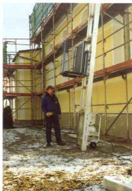
Der GEDA®-COMBILIFT 200 Z im Schrägeinsatz mit Universalpritsche.