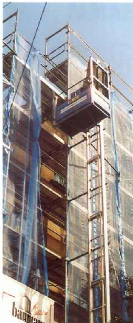
Der GEDA-COMBILIFT 200 Z im Senkrechteinsatz mit Lastbühne.