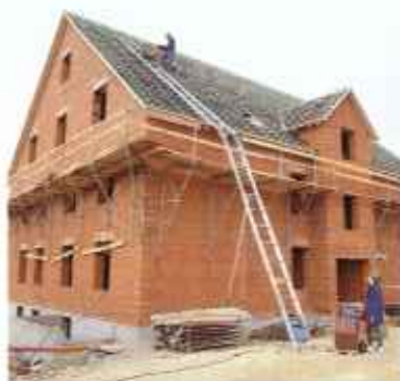
Schrägaufzüge mit Seil