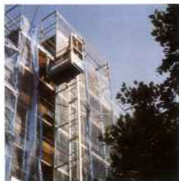
Schräg- und Senkrechtaufzug mit Zahnstange