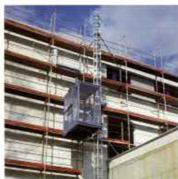
Personen- und Lastenaufzüge