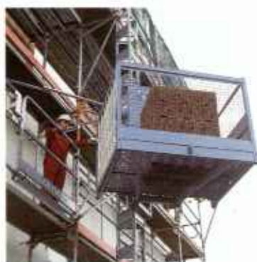
Zahnstangenaufzüge mit Stahlmast