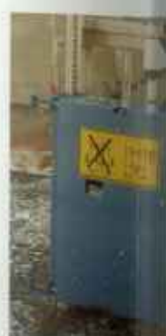
Die kompakte Grundeinheit für Senkrechteinsatz – besteht aus: