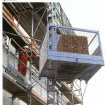
Зубчато-реечные подъемники со стальной мантой