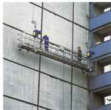
Подвешенные рабочие платформы (люльки)