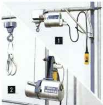
Катаные подъемники: ■ с консольной поворотной стрелой ■ с креплением на лесах