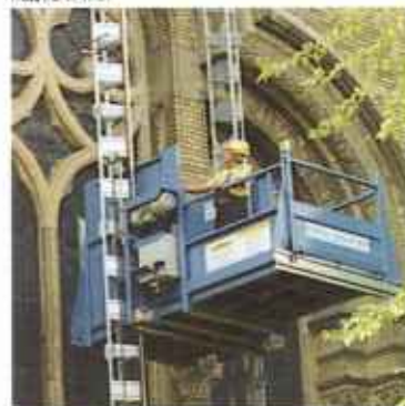
Транспортные платформы – Грузопассажирские подъемники