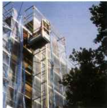
Наклонные и вертикальные зубчато-реечные подъемники