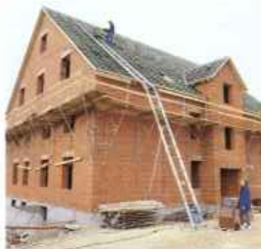
Наклонные подъемники со сталеволоконным тросом