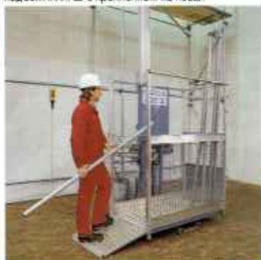
Зубчато-реечные подъемники с алюминиевой мантой